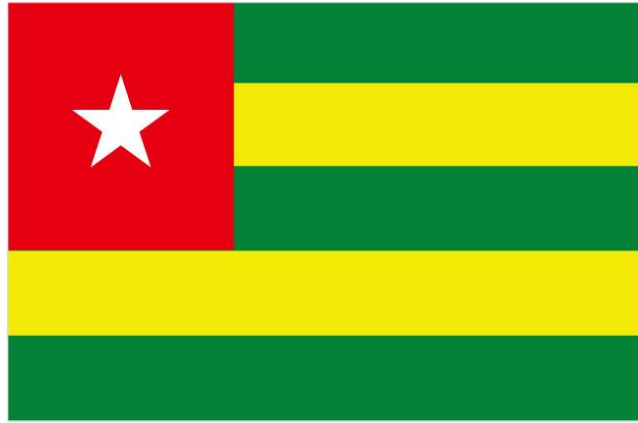
图 2 多哥国旗