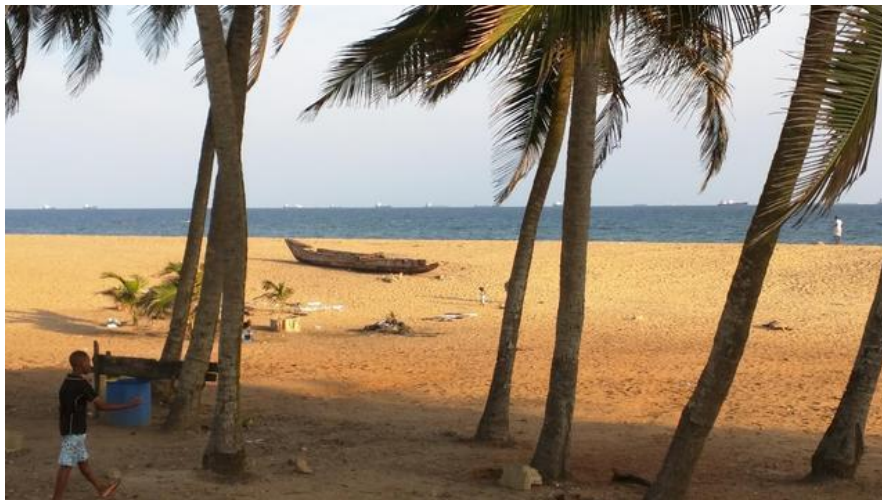
图 3 多哥风景

多哥是传统农业国，农业是国家经济的支柱，为多哥贡献了 60%的就业岗位和 GDP 的 40%以上。主要粮食作物有木薯、参薯、玉米、黍和高粱、稻米、豆角等。